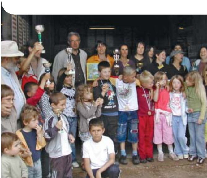
FÊTE DE L'ENFANCE, 6 JUIN 2009 PALMARÈS

En cas de pénurie de places, les enfants seront placés sur liste d'attente et ne peuvent être accueillis que si une place se libère. ●