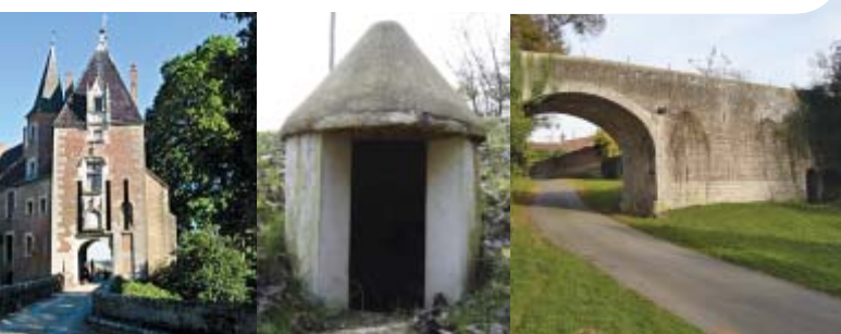
DE GAUCHE À DROITE LE CHÂTEAU, LA FONTAINE DU PLOUSIN OÙ LOUIS XIV S'ARRÊTA BOIRE, ET LE PONT ENJAMBANT LA RUE DE L'ÉGLISE

Ce circuit, le plus long des itinéraires proposés par Rives de Saône allie découverte du patrimoine rural de notre secteur et découverte de la nature. Les bords de Saône sont protégés et présentent une richesse faunistique et floristique variée. Il est situé en limite de la forêt de Citeaux classée Natura 2000 (protection du crapaud sonneur à ventre jaune).