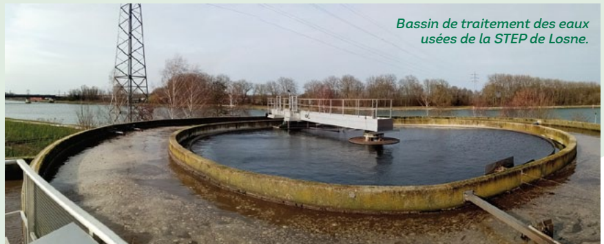
Bassin de traitement des eaux usées de la STEP de Losne.

À l'appui de ce contrôle, si l'exécution des travaux est conforme au dossier de conception, un certificat de conformité de votre installation vous sera remis. Ce document vous sera demandé lors des contrôles périodiques de votre installation et sera nécessaire à la vente de votre habitation.